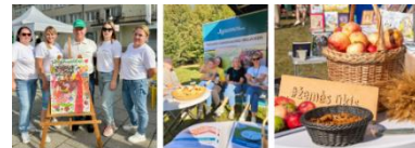
Renginių rajonuose akimirkos

Rugpjūčio mėnesį startavo renginiai rajonuose. Dalyvauta Biržuose, Šilutėje, Šilalėje, Kėdainiuose, Skuode, Tauragėje, Pasvalyje, Švenčionyse, Ignalinoje, Kupiškyje, Varėnoje, Rokiškyje vykusiuose renginiuose, kai kuriuose rajonuose lankytasi kelis sykius. Renginių metu žaismingai pristatytos LŽŪKT paslaugos bei veikla, megzti santykiai su vietos bendruomene.